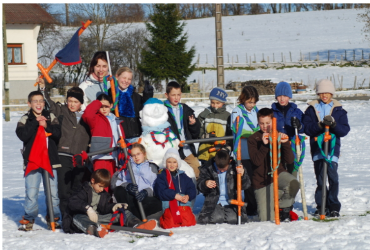
FIG. 2 – Les louveteaux lors du dernier week-end

Pour y parvenir nous avons une méthode scoutie permettant à chacun de découvrir le monde qui l'entoure, d'y trouver sa place et de progresser en devenant acteur de ses projets, de sa vie et de la société.