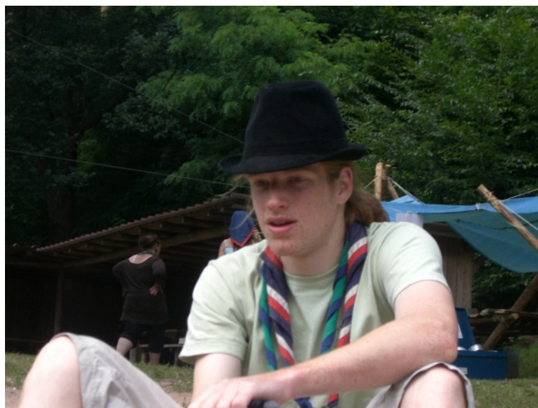
FIG. 3 – Toi aussi, tu as un rôle à jouer

Nous sommes scouts au quotidien pour construire le monde de demain, et toi ? Est-ce que ce combat n'est pas aussi le tien ?